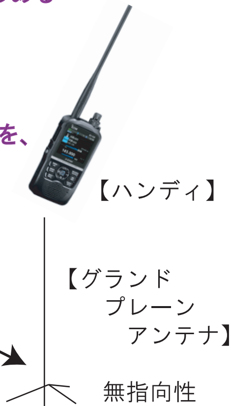
【グラウンド プレーン アンテナ】